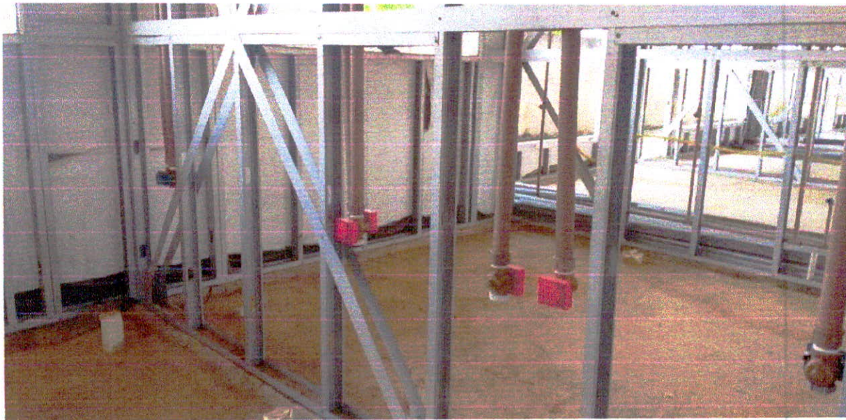
Fotografia 7 – Instalações de Água Fria executadas.