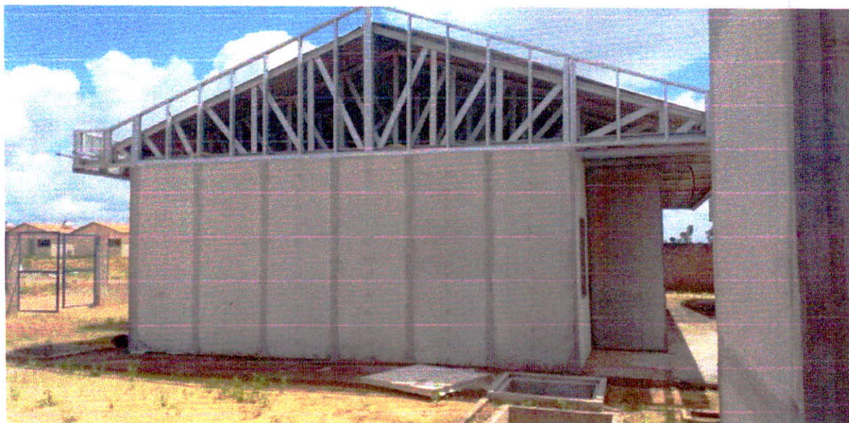
Fotografia 11 – Oitões com telhas metálicas não executadas.