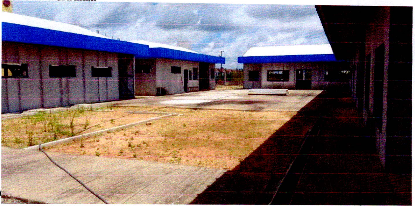
Fotografia 19 – Tratamento de juntas das placas cimentícias dos Blocos.