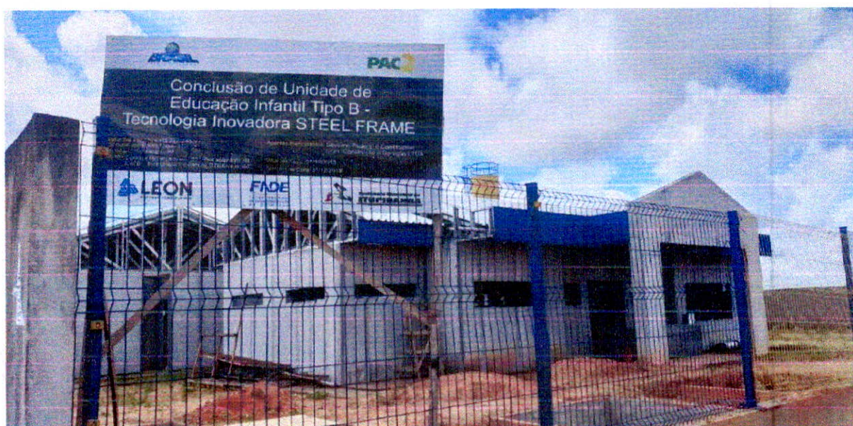
Fotografia 2 – Frente da Obra da Creche de Cidade Nova.

No ato da vistoria foram verificadas as Inconformidades apontadas pelos fiscais do FNDE, e já foram superadas e/ou justificadas, inclusive algumas estão sob análise do FNDE. Os recursos recebidos foram repassados a empresa contratada a fim de dar continuidade aos serviços, no entanto o prosseguimento não foi possível devido as exigências estabelecidas. Segue abaixo um Relatório Fotográfico da última vistoria realizada que comprovam os percentuais executados: