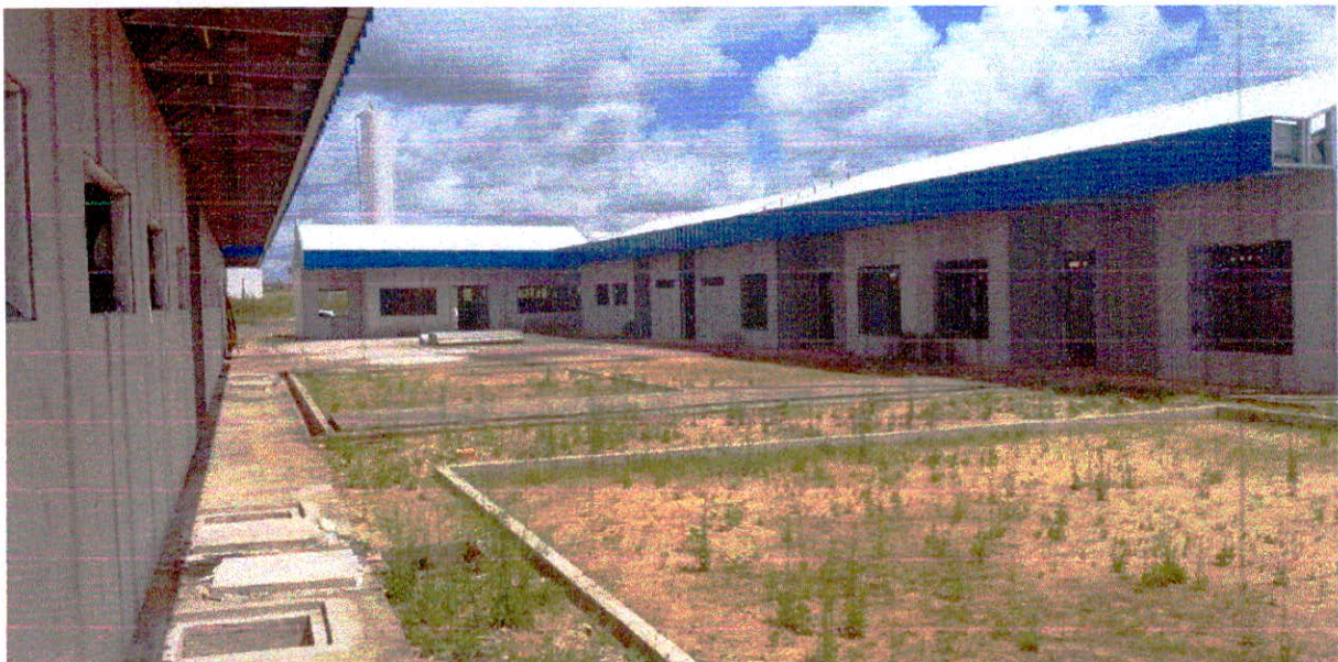
Fotografia 4 – Vista geral dos Blocos da Creche.