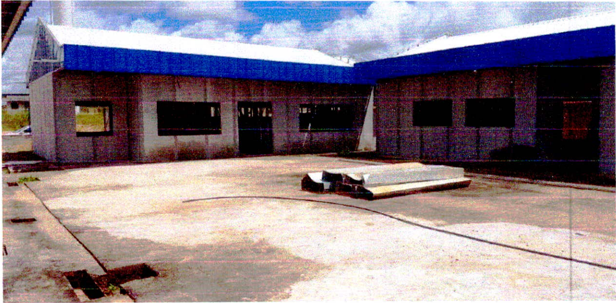
Fotografia 17 – Blocos Administrativo e Multiuso vedados e cobertos.