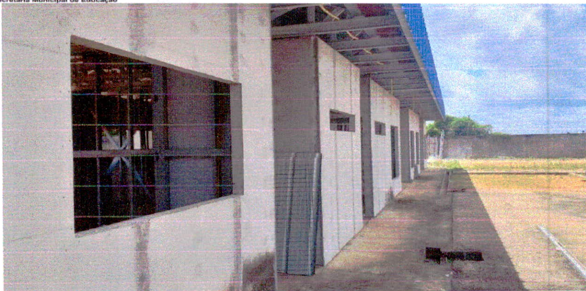
Fotografia 5 – Blocos Multiuso e Pedagógico II vedados e cobertos.