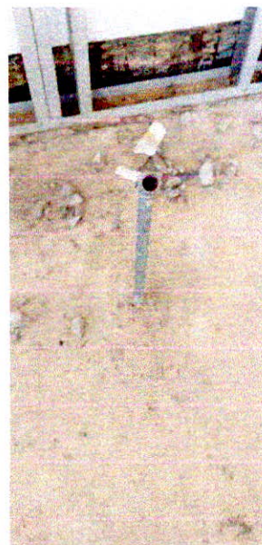
Fotografia 14 – Instalações de gás combustível com tubos e conexões executados.