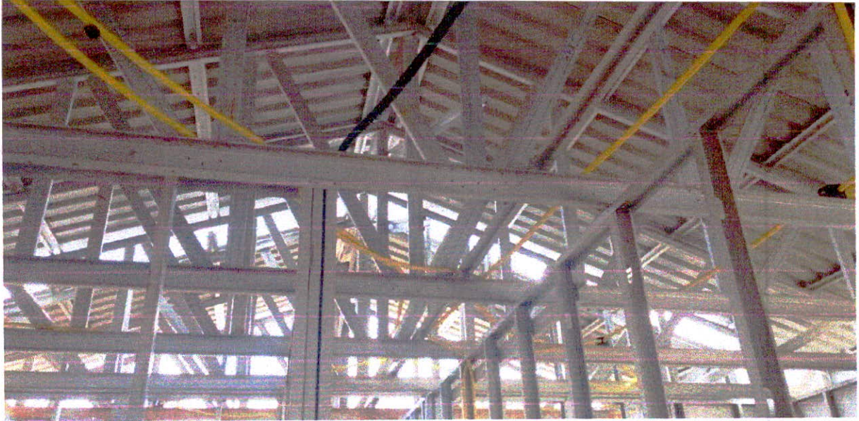
Fotografia 3 – Tesouras metálicas do Bloco ADM da Creche.