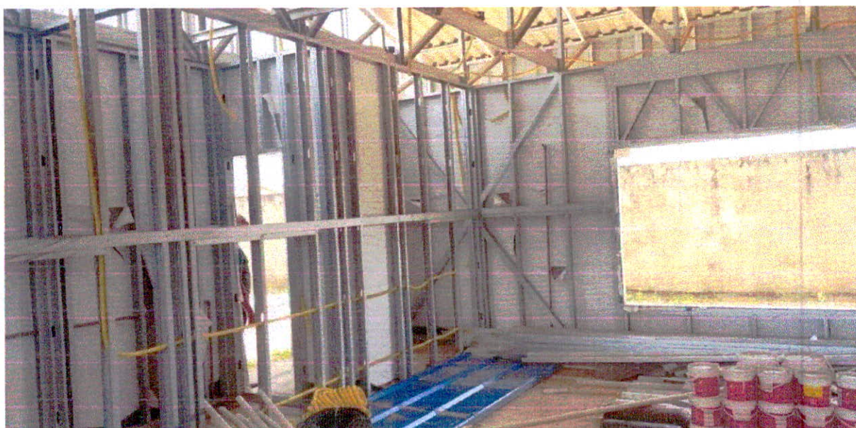
Fotografia 6 – Barreira de umidade executada em todas paredes externas.