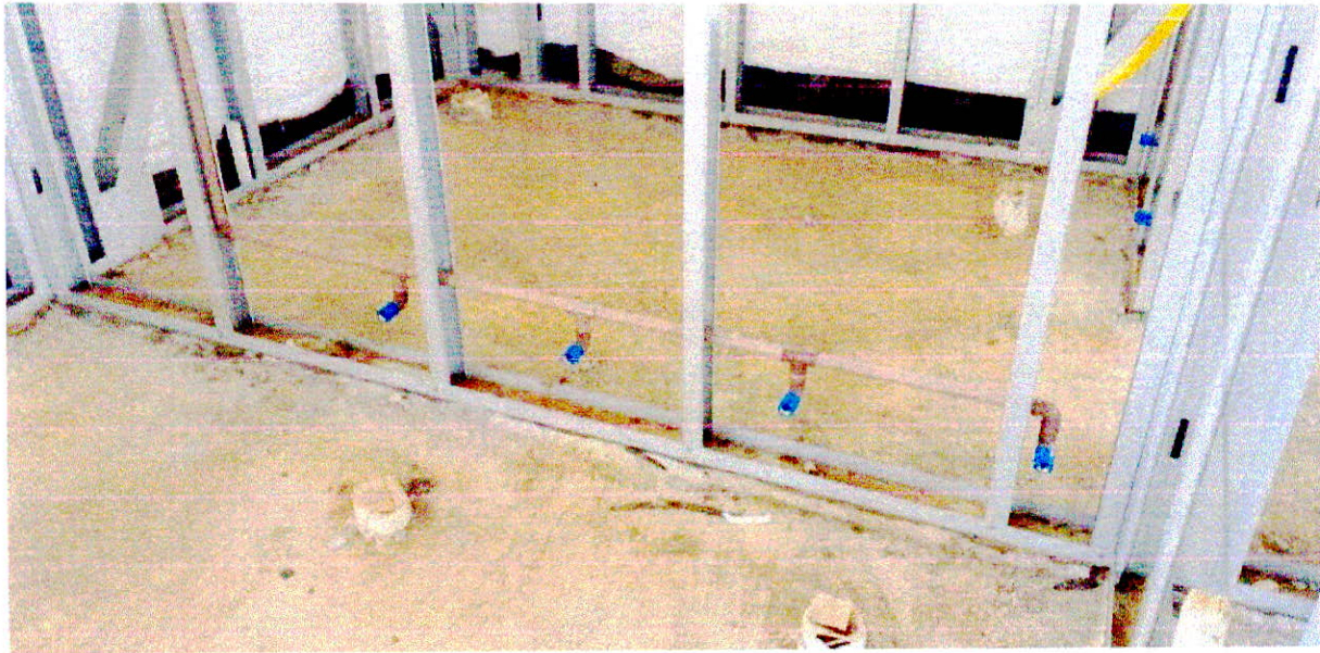
Fotografia 15 – Instalações sanitárias a serem corrigidas.