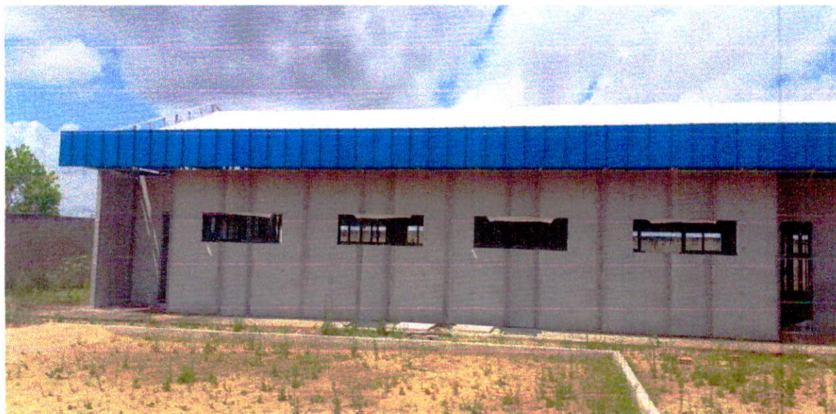
Fotografia 12 – Bloco Pedagógico I vedados e cobertos.