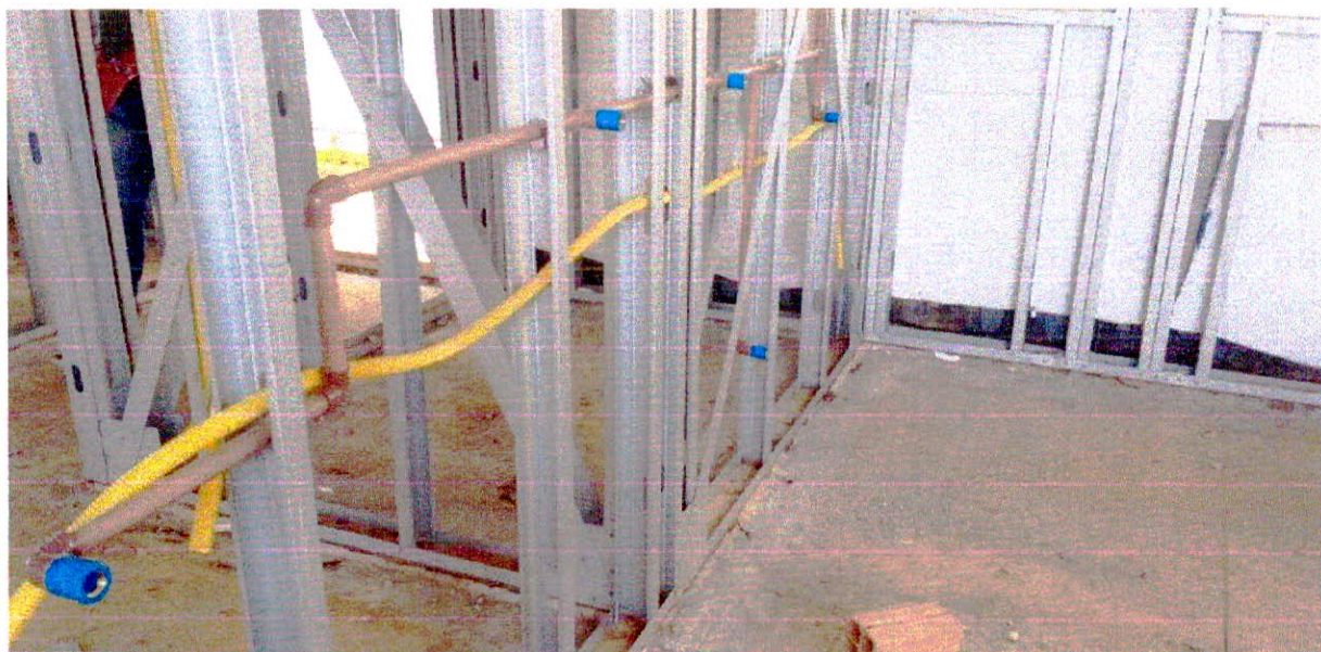
Fotografia 18 – Instalações executadas e todas as paredes da Creche montadas.