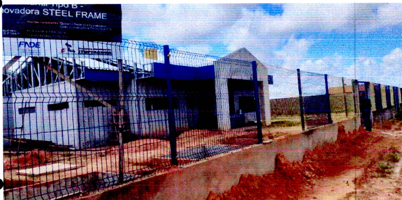
Fotografia 1 – Fachada principal da obra.