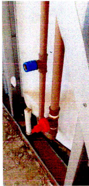
Fotografia 13 – Instalações de água fria com tubos e conexões executados.