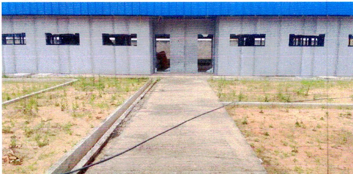
Fotografia 10 – Piso de passarela coberta executado.