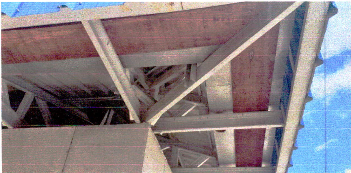
Fotografia 8 – Calhas executadas.