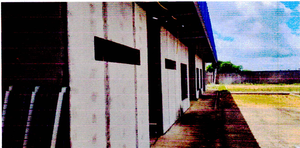
Fotografia 16 – Detalhe do tratamento de juntas nas paredes externas.