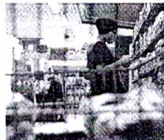
O excesso de exportações reduz a oferta interna e pressiona os preços.

O reajuste de preços neste ano se estende para praticamente todos os setores da alimentação, muitos deles com a oferta interna reduzida devido às exportações.